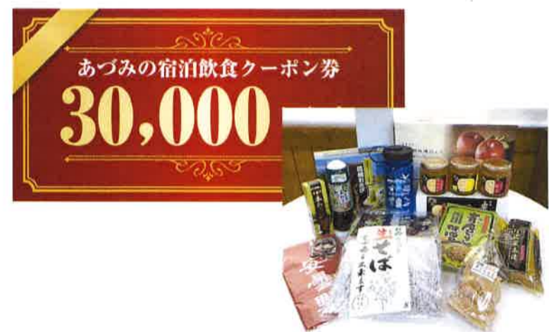
賞品はイメージです

★お一人、何口でも応募できます。ただし専用応募台紙1枚につき、一口のご応募とさせていただきます。 専用応募台紙(冊子)は、参加店、商工会、観光協会等にあります。